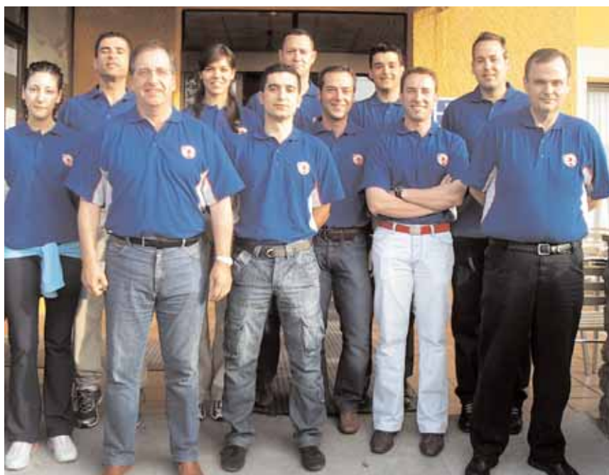
Intersector Cadete Masculino de Plasencia