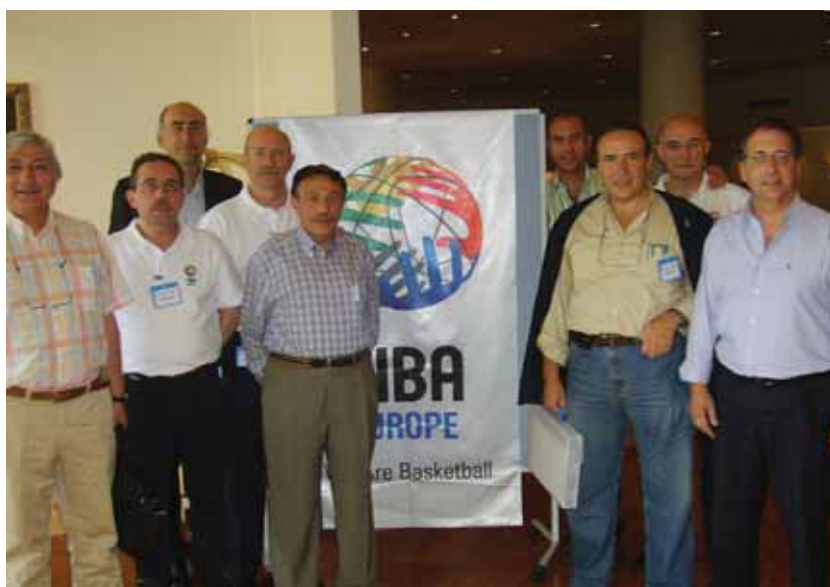
Comisarios españoles participantes en el Clinic