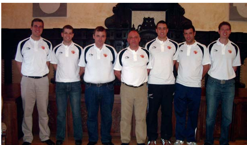
Árbitros y técnicos asistentes al Sub'20 en Astorga

El Circuito Sub'20 ACB/FEB alcanza ya su tercera concentración, e inmersos en el espectáculo del mejor baloncesto joven, empiezan a perfilarse los candidatos a jugar la Fase Final. En esta ocasión, las ciudades de Sevilla, Valladolid y Granada acogieron los encuentros de la Serie "A", alzándose con el primer puesto las canteras de Unicaja Málaga, MMT Estudiantes y C. B. Granada respectivamente.