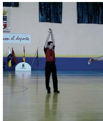
Sub'20 de Telde