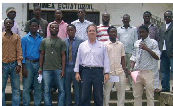
Asistentes al curso de árbitro en Guinea Ecuatorial

sidente del Comité Técnico Arbitral, quienes asuman la responsabilidad de continuar con la formación de este grupo, ya que "lo que pueden adquirir en una semana son conceptos muy básicos, y todo esto hay que ponerlo en práctica en los partidos" .