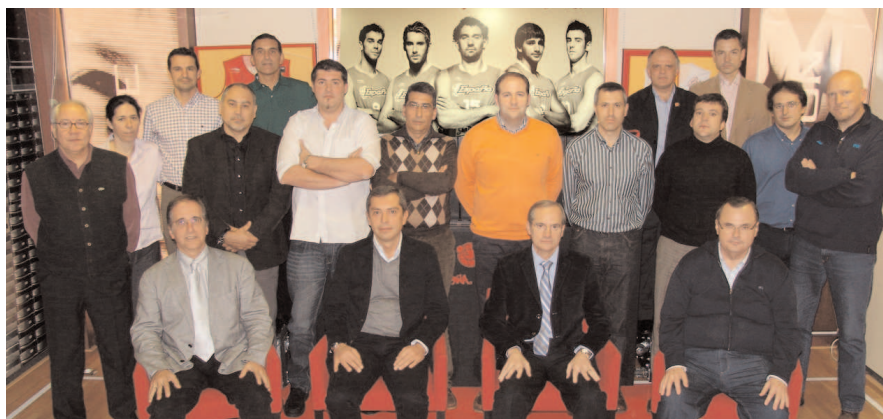
Reunión de Técnicos del Área Arbitral FEB