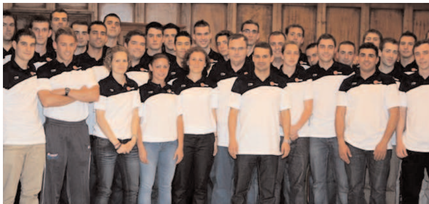
Los árbitros de Federaciones Autonómicas tienen su primer contacto con la FEB en el Campeonato de España de MiniBasket de San Fernando 2010