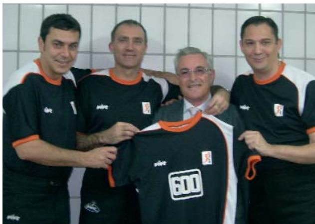
Entrega de la camiseta conmemorativa de sus 600 partidos en ACB

Desde tu amplia experiencia en la Liga ACB, ¿cómo consideras que han evolucionado esta competición y su arbitraje?