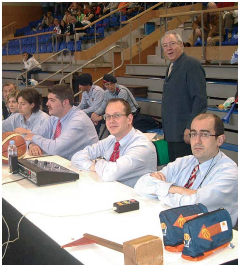
Los oficiales de mesa realizaron una labor impecable

Los partidos se grababan con dos cámaras, y Pedro Rocío nos comentaba lo más relevante que teníamos que ver. Además, al visualizarlo pocas horas después del partido, te acordabas perfectamente de cada situación.